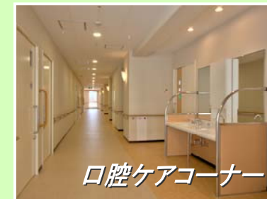
口腔ケアコーナー

各ユニットに口腔ケアコーナーがあります。虫歯や歯周病、気道感染や誤嚥性肺炎の予防や口腔機能の維持・増進することを目的に毎日実施しています。