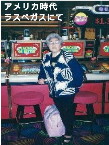
アメリカ時代 ラスベガスにて

不景気になっており、暗いイメージがしました。しかし、街並みは立派になり、交通の便はよくなりました。バスでどこへでも行けるし、やはり老後は日本がいいねーと思えましたよ。昨年嫁がまやるちよーくへの参加をすすめてきて、最初は行くのが嫌だったんですよ。でも、来てみたら楽しくて(笑)。タイトル・絵画・パワリハなどいろいろなプログラムに参加しています。私は耳が聞こえにくいことをとても気にしていましたが、まやるちよーくではもっと体の不自由な人もいますし、それでもリハビリなど頑張っている人もいます。そんな姿を見たり、お友達と話をすると、自分も前向きになれるんですよ。アメリカでの陽気な生活も現在の私を作ってくれたのかも... 幸せを感じる日々です。