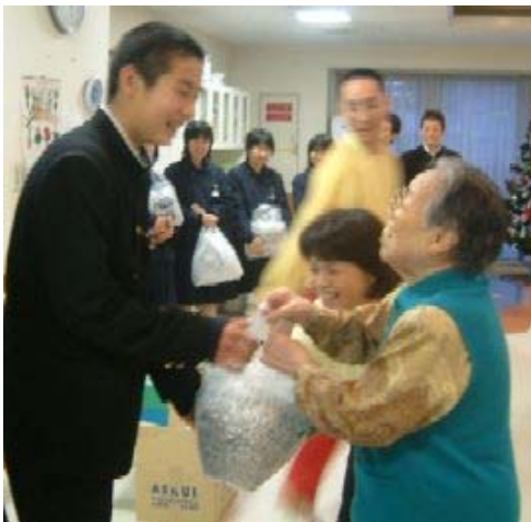
▲ ご利用者様から直接手渡しして 頂きました。