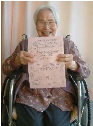
▶『いきいき人生計画表』を手にニッコリ！