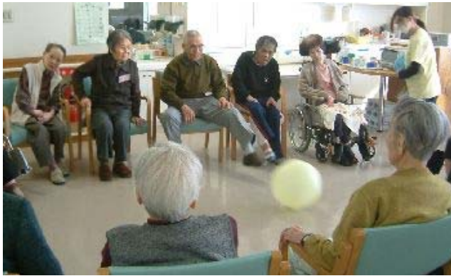
▲ボールを使っのりハビリ風景

温かいお茶がひときわおいしい毎日です。寒い真冬、皆様いかがお過ごしでしょうか？今月は、あすかショートステイでの、生活リハビリの取り組みについて、紹介します。ご覧になられた方もいらつしやると思いますが、より快適に、より健康的に毎日を過ごして頂けるように、おひとりずつ、『いきいき人生計画表』を提案させて頂いております。この中で、生活リハビリのポイントを掲げ、ご利用者様に関わるスタッフみんなで連携して取り組み、少しでもいきいき、はつらつと過ごして頂けるように努めております。