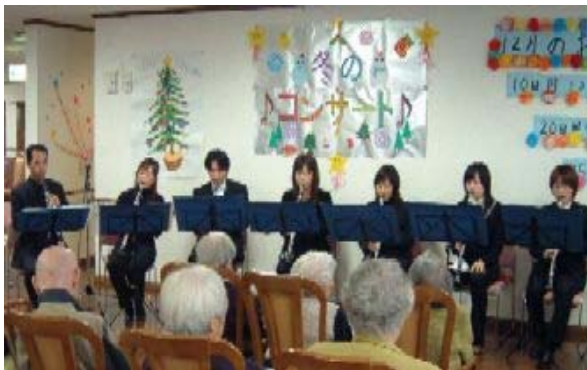
▲ きれいな音色に聞き入っています！

あつという間に時間が過ぎていき、とても楽しいひとときでした。アリオソの皆様ありがとうございました。