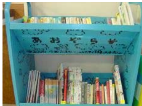
ショートにある移動図書館 「あおぞら号」