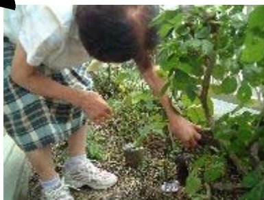
楽しみにしていた収穫の時！