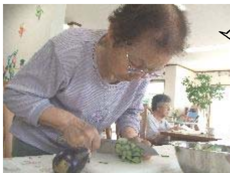
さあ！お料理しましょっ！

今はサツマイモが土の中で育っています。スイートポテトを作るつ。お汁に入れよう。焼き芋でパーティーをしよう。さつまいもの茎で副菜を作ろうと話が盛り上がっています。