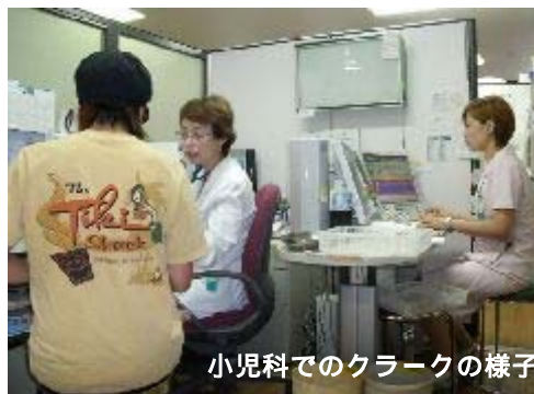
小児科でのクラークの様子

Q 患者様やご利用者様が気持ちよく安心して、あすかの医療施設や介護事業所を利用して頂けるよう職員一同おもてなしの心を醸成していくための活動です。現在は医療法人あすかのクレド(信条)を作っています。 先日、院外で患者様に出会った時「さん、こんにちは」とご挨拶しましたらたราบびっくりされ、お名前をお呼びしたことをとても喜んで下さいました。