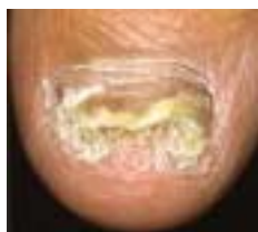
高齢者に多いのが 爪白癬

日本人の5人に1人が持っているという水虫、60歳以上の場合はさらに4人に1人以上が水虫ともいわれています。人間は歳を重ねるほどにさまざまな病気にかかりやすくなります。水虫も例外ではなく、高齢者に多いようです。水虫は、カビの一種の白癬菌が皮膚に付着し感染することによって起こされます。