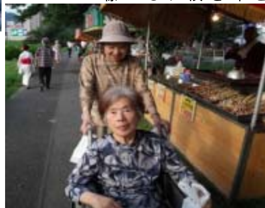
美味しいもの ▶ たあ~くさん