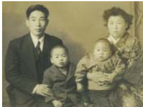
昭和26年 当時28歳 ご主人とお子さんたち お腹のなかには3人目のお子さん