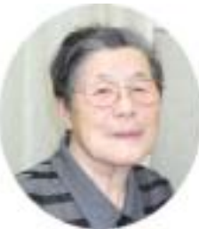
片陰に 幼児相手 折紙す