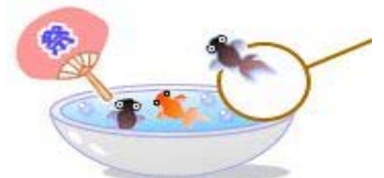
はっぴを着て祭り気分