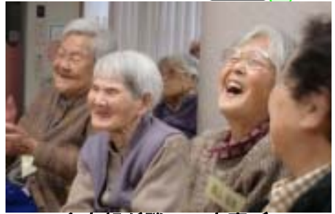
金太郎が勝って大喜び

郎の勝利！次に高島部屋の大関・横綱と相撲で勝負！のこったのこった、どすこいどすこいと大きな大きな関取を簡単に寄り切り、またまた金太郎の勝利！金太郎があまりにも強い為相撲部屋からのスカウトで修業することに。金太郎は一生懸命に修行し日本一強く優しい男になり、お爺さんお婆さんと幸せに暮らしましたとき。めでたし、めでたし・・・。 色々なハプニングの起こる中、笑いあり、涙あり・・・ 来年もまやる一座で会いましょう