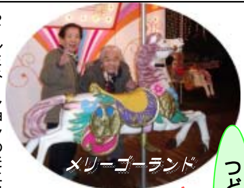
メリーゴーランド