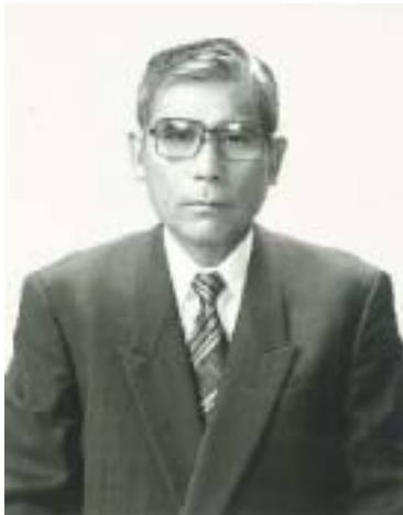
▶ 55歳頃のお写真 とつてもダンディで素敵です

たんよ。それからわしもだんだんと足が悪くなつてまやるちよーくに通いだしたんじゃが、まやるちよーくに入つて数カ月後にすてっぶが出来たんよ。すてっぶはリハビリ中心で、身体の現状維持ができるし、家では動かさん体もすてっぶに来れば動かすことができるけええんよ。今は足をしっかり上げて歩きたいんじゃ。歩いて、いろんなところに行つてみたいと思つとるんじゃ。家内と二人で散歩でもしてみたいの。