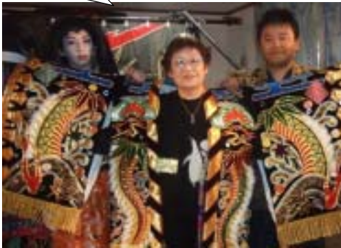
豪華な衣装は300万～500万円！