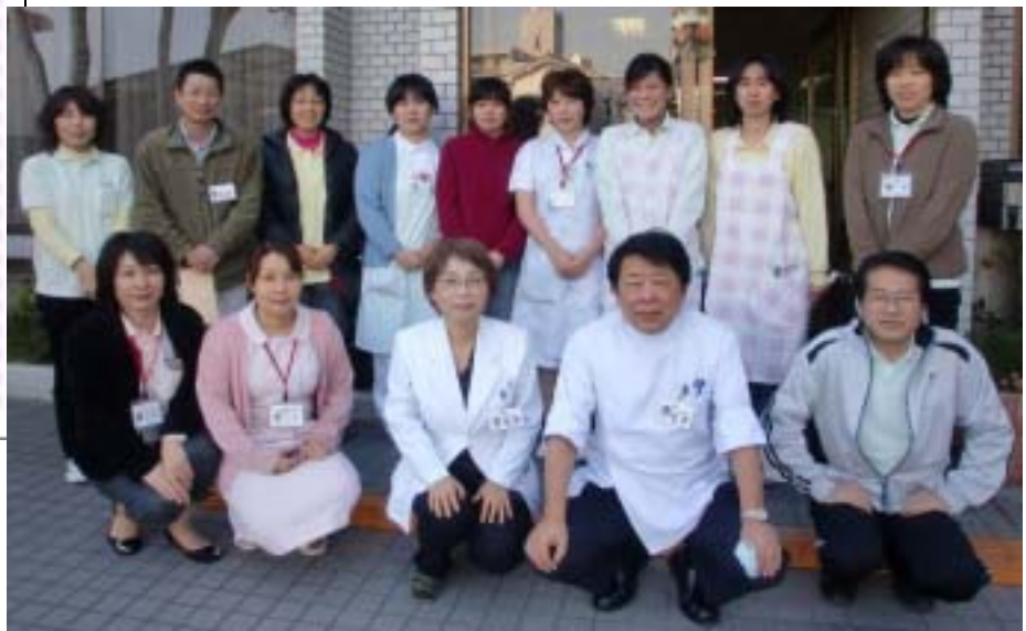
クレドを作成したメンバーと一緒に記念写真を撮りました